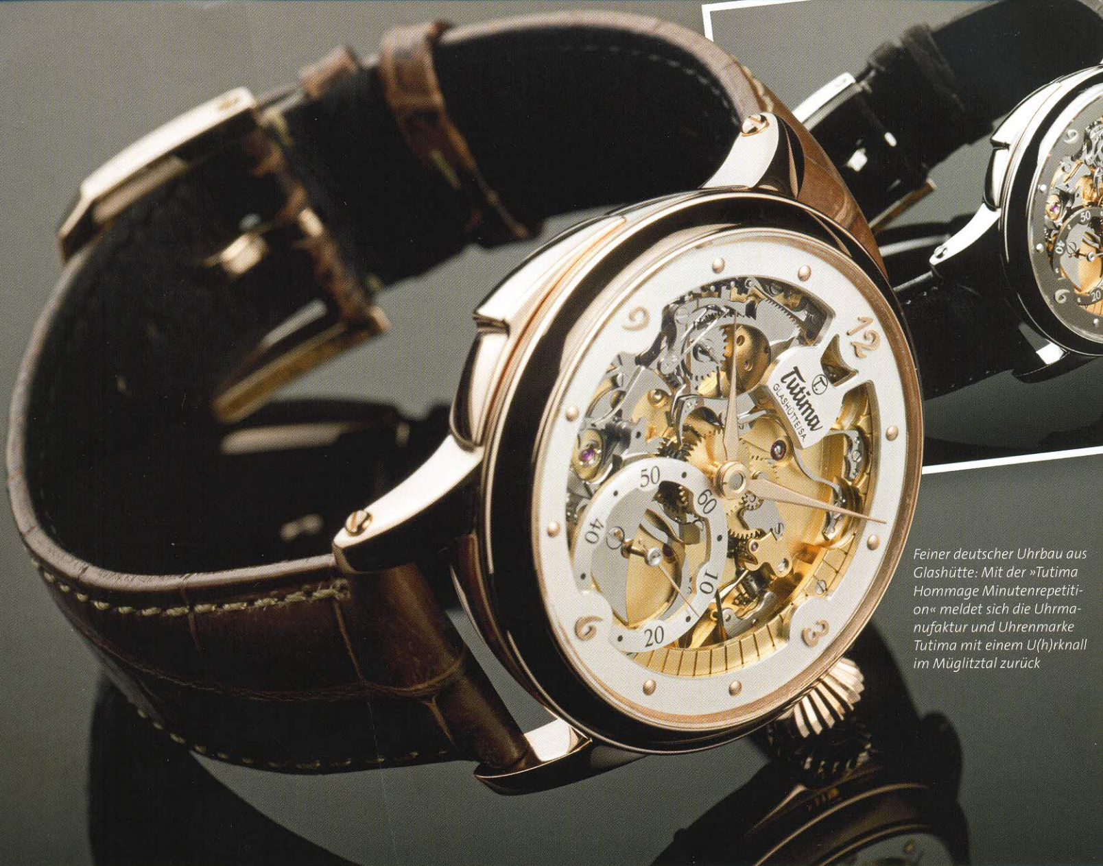
Feiner deutscher Uhrbau aus Glashütte: Mit der »Tutima Hommage Minutenrepetition« meldet sich die Uhrmanufaktur und Uhrenmarke Tutima mit einem U(h)rknall im Müglitztal zurück