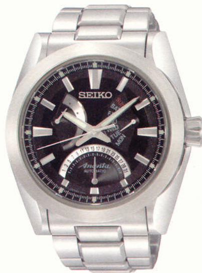
Seiko: Ananta; Automatik, Edelstahlgehäuse, Lederband, druckfest bis 10 bar (2.000 Euro)