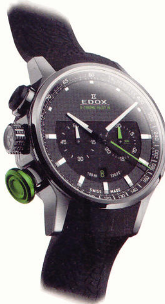
Edox: X-Treme Pilot III; Quarz, Chronograph, Edelstahlgehäuse, Kautschukband, druckfest bis 10 bar (1.890 Euro)