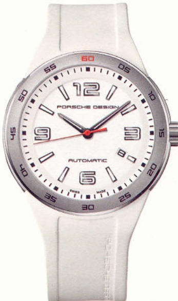
Porsche Design: Flat Six; Automatik, Edelstahlgehäuse, Kautschukband, druckfest bis 12 bar (1.980 Euro)