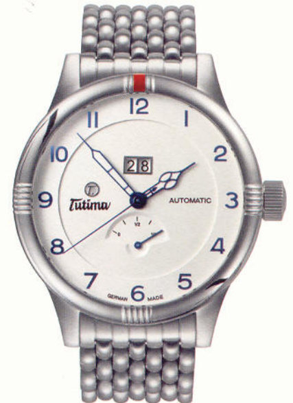
Tutima: Grand Classic; Automatik, Edelstahlgehäuse, -band, druckfest bis 10 bar (1.990 Euro)