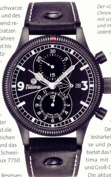
Der »Grand Classic Black Chronograph PR« weiß auch mit schwarzem Zifferblatt und mit schwarzem Lederband zu überzeugen.

Die neue »Grand Classic Reserve« ist auf den ersten Blick ein typischer Tutima-Klassiker wie man ihn kennt, gebaut nach dem Vorbild des legendären historischen Tutima-Fliegerchronographen. Auf den zweiten Blick präsentiert sich das Edelstahlgehäu-