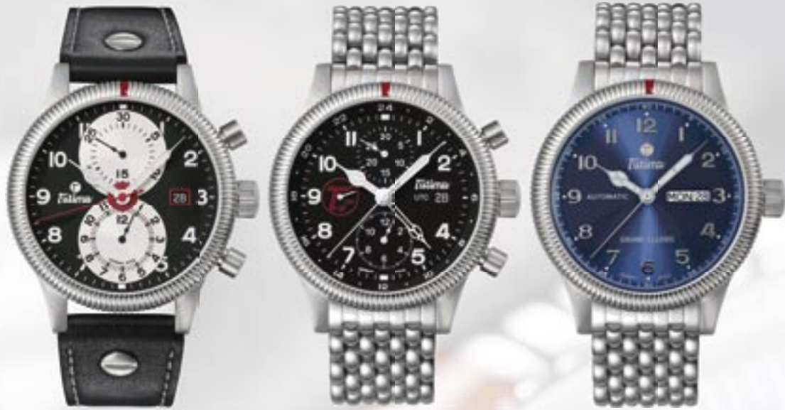
Grand Classic, Ref. 781-05: Chronograph mit großen Anzeigen für 30 Minuten und 12 Stunden, Stoppfunktion, Preis: 1800 Euro*.

Eine Besonderheit aller Modelle der Baureihe „Grand Classic“ ist der Saphirglasboden mit einem großen Tutima „T“ und der Jahreszahl 1927. Die Geschichte von Tutima begann im Jahre 1927 in der sächsischen Uhrenstadt Glashütte mit der UROFA (Uhren-Rohwerke-Fabrik Glashütte AG) und der UFAG (Uhrenfabrik Glashütte AG).