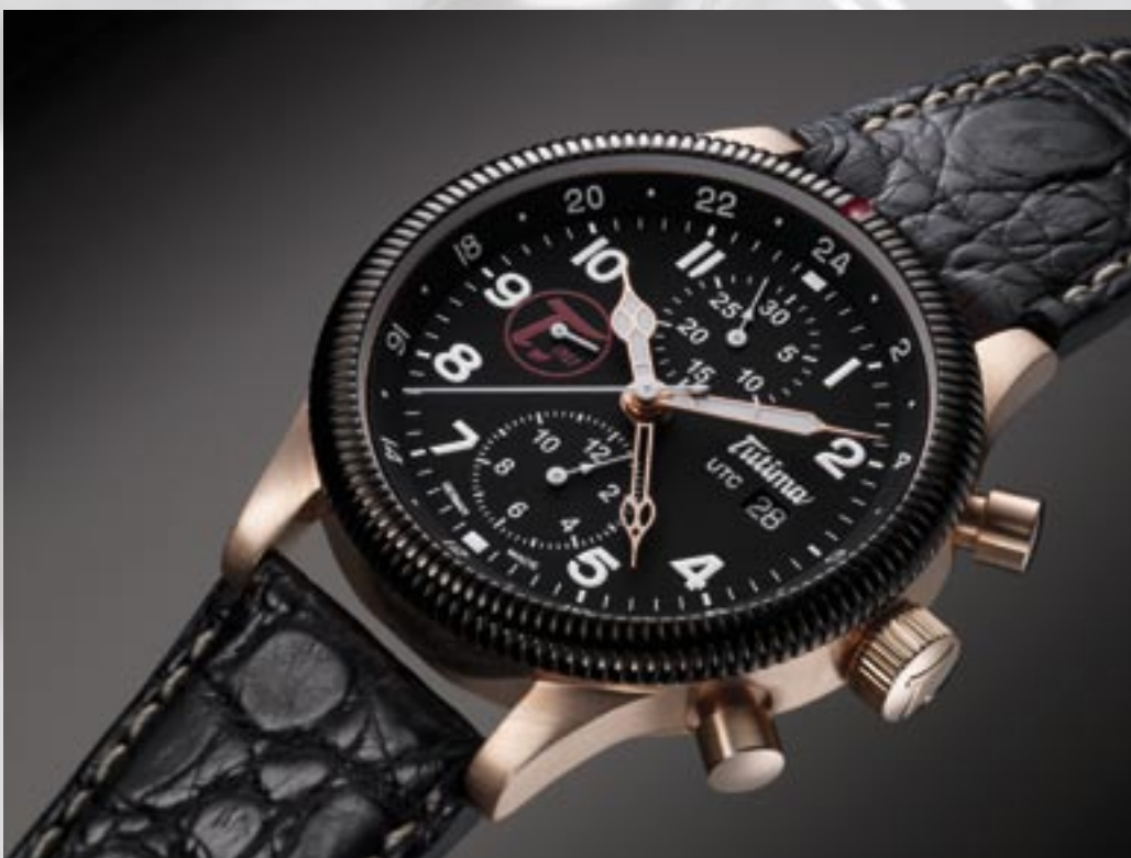
Grand Classic „Alpha“, Ref. 789-01: Limitiert auf 100 Exemplare. Keramik-Lunette, Gehäuse und Arbandschließe aus 750/000 Rotgold, UTC-Funktion (zweite Zeitzoneanzeige). Preis 9900 Euro*.

Bei einem Gehäusedurchmesser von 43 Millimetern wird die Zeit zu einem ganz besonderen Erlebnis. Die Grand Classic „Alpha“ von Tutima ist eine sichere Investition in die Zukunft. Sie ist auf 100 Stück limitiert und ist ausgestattet mit einem massiven 750/000 Rotgoldgehäuse mit drehbarer Keramik-Lunette und dem mechanischen Chronographen-Werk Valjoux 7754.