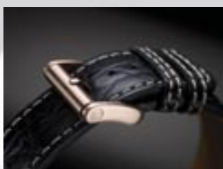
Armbandschließe aus 750/000 Rotgold.

Neben den Chronographenfunktionen bietet das Automatikwerk Valjoux 7754 die „koordinierte Weltzeit“, die international als UTC abgekürzt wird.