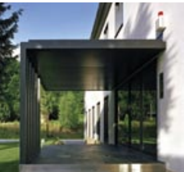
Das Tutima-Gebäude in Glashütte.