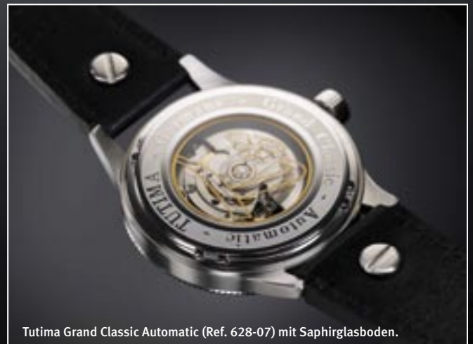
Tutima Grand Classic Automatic (Ref. 628-07).