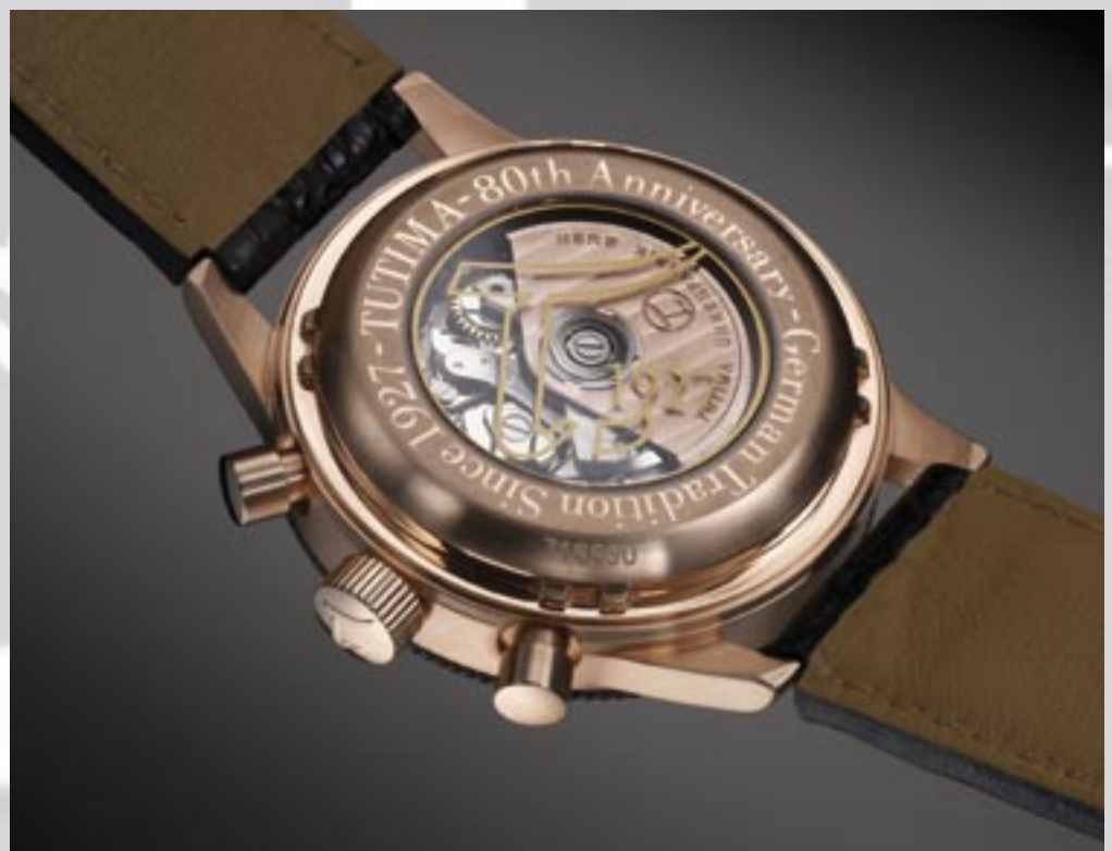
Verschraubter Gehäuseboden der Grand Classic Alpha (Ref. 789-01) mit Saphirglas und dem Tutima „T“ sowie dem Hinweis auf das Gründungsjahr 1927.