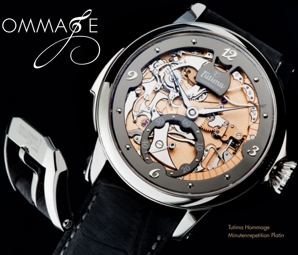
Tutima Hommage Minutenrepetition Platin