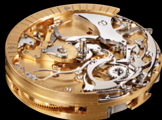
Werkansicht oben Hommage Kaliber 800