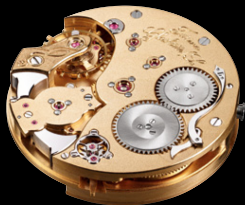
Werkansicht unten Hommage Kaliber 800