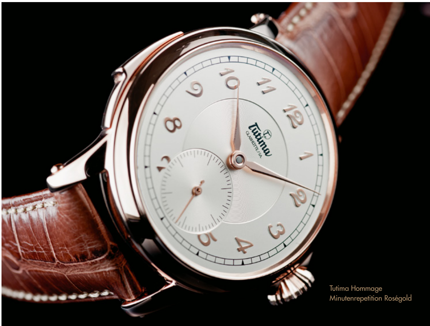
Tutima Hommage Minutenrepetition Roségold