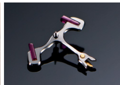
Stahlanker mit bombierten Paletten