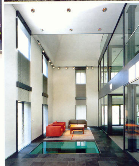
Dr. Ernst Kurtz gilt als Vater der Uhrenmarke Tutima (o.); Blick in die Halle des modern gestalteten Gebäudes: Unter der begehbaren Glasplatte ist die Werkstatt für Teilefertigung, die im Wesentlichen aus einer modernen CNC-Maschine besteht