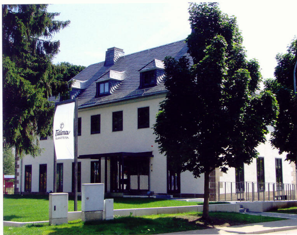
Das sehr hochwertig restaurierte Firmengebäude diente früher der Verwaltung des Glashütter Bahnhofs als Domizil