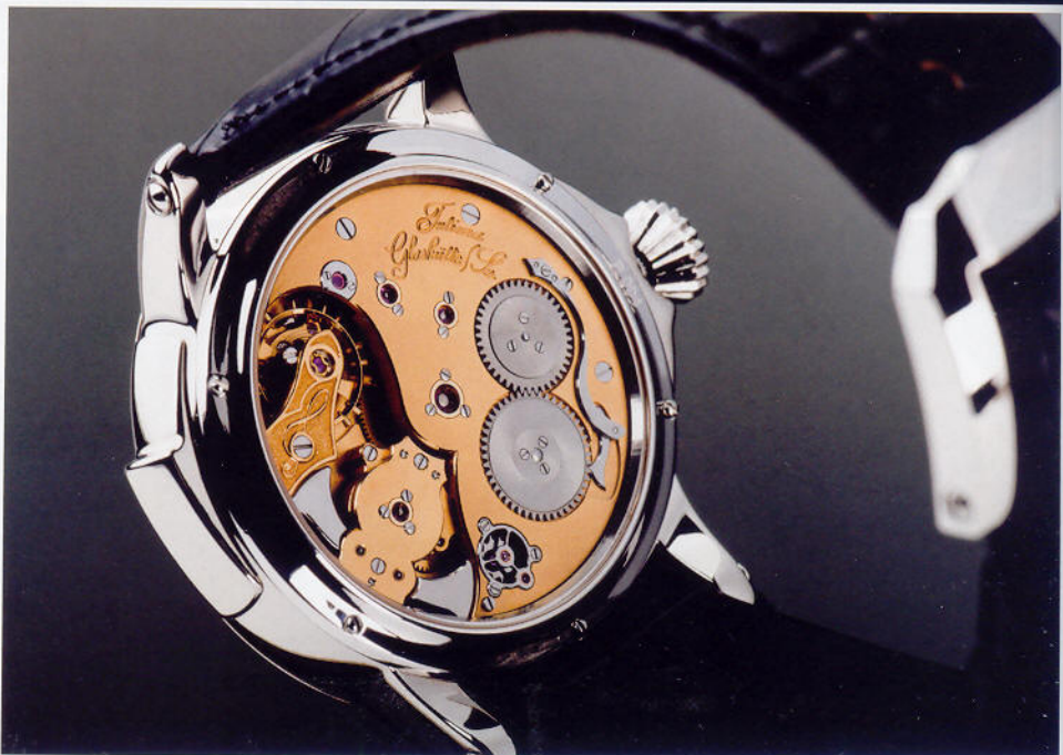
Das Uhrwerk der „Homage“: Vorn sieht man die hochglänzenden Schlagwerk-hämmer, rechts die fein geschliffenen Stahlräder des Aufzugs. Typisch sind die rund geschliffenen Schrauben und die Teile in verschraubten Gold-Chatons. Das Uhrwerk hat eine Gangreserve von 72 Stunden