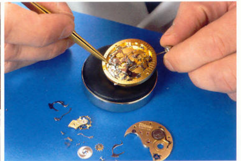
Blick in die modern eingerichtete Uhrenwerkstatt in Glashütte (l.); Montage eines „Hommage“-Uhrwerks (r.)