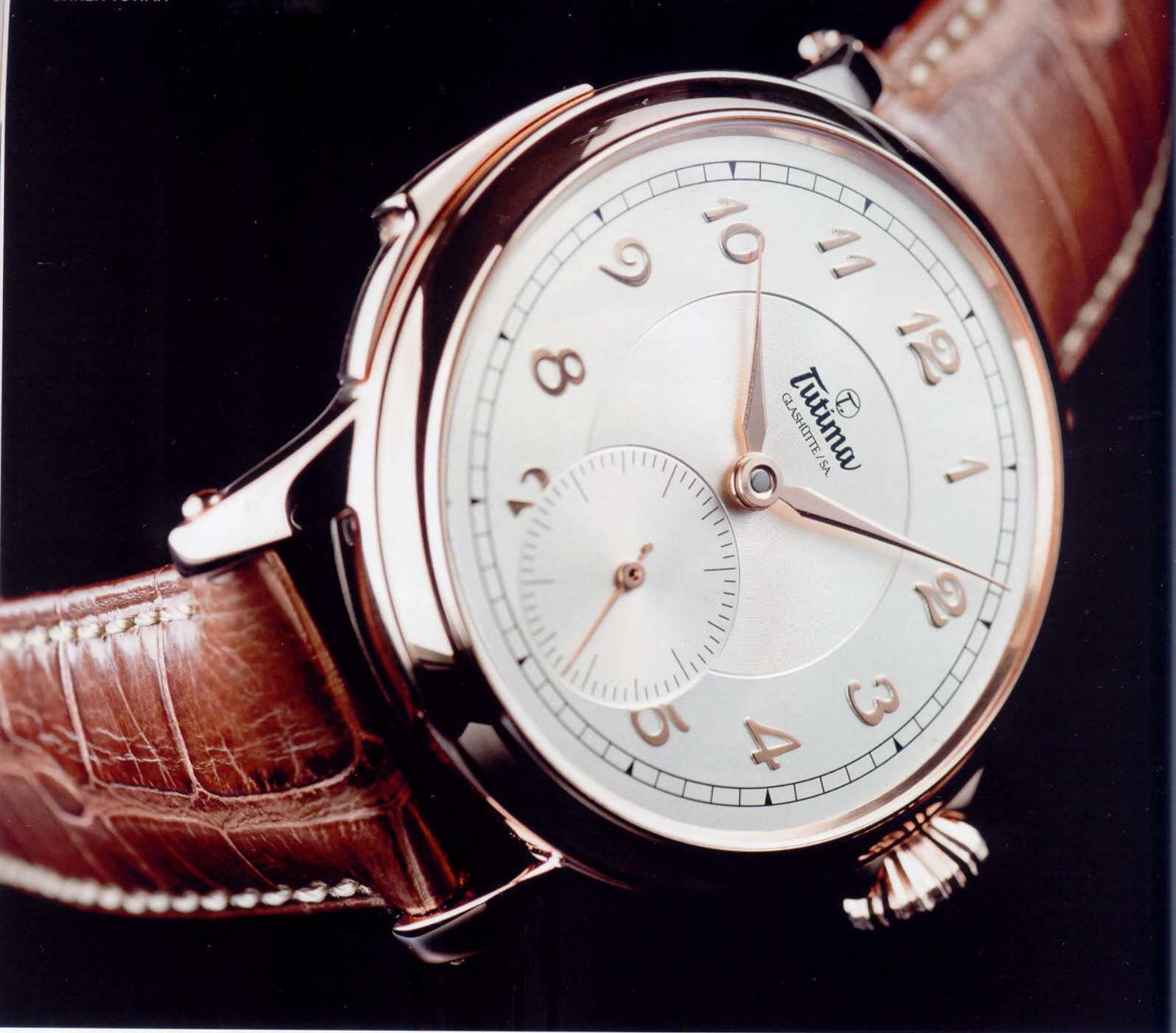
Die „Homage“ von Tutima ist die erste vollständig in Glashütte gebaute Minuten-Repetitionsuhr