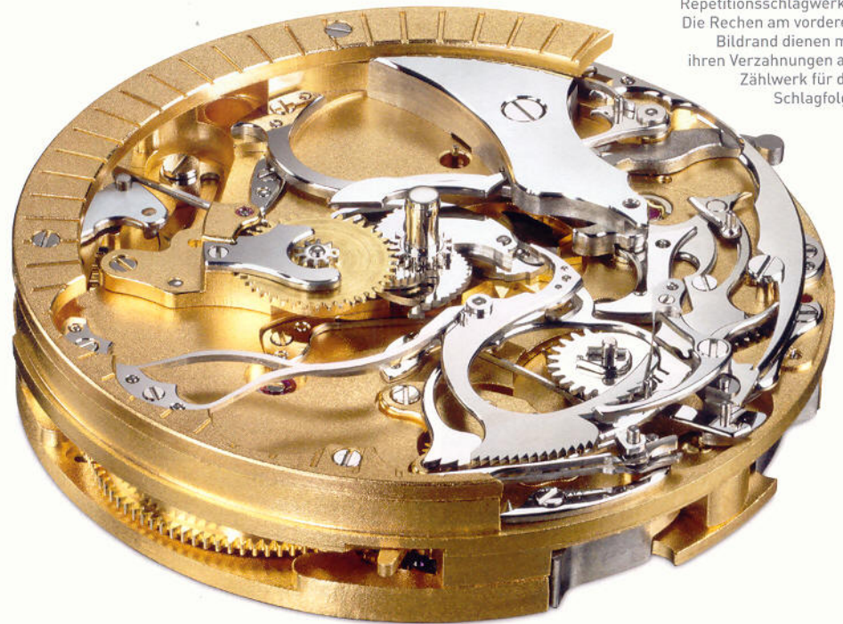
Die Mechanik des Repetitionsschlagwerks. Die Rechen am vorderen Bildrand dienen mit ihren Verzahnungen als Zählwerk für die Schlagfolge